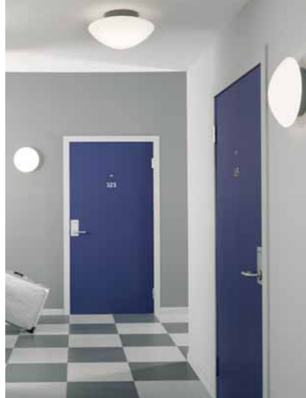
Gudahagen i tak Solhem på vägg